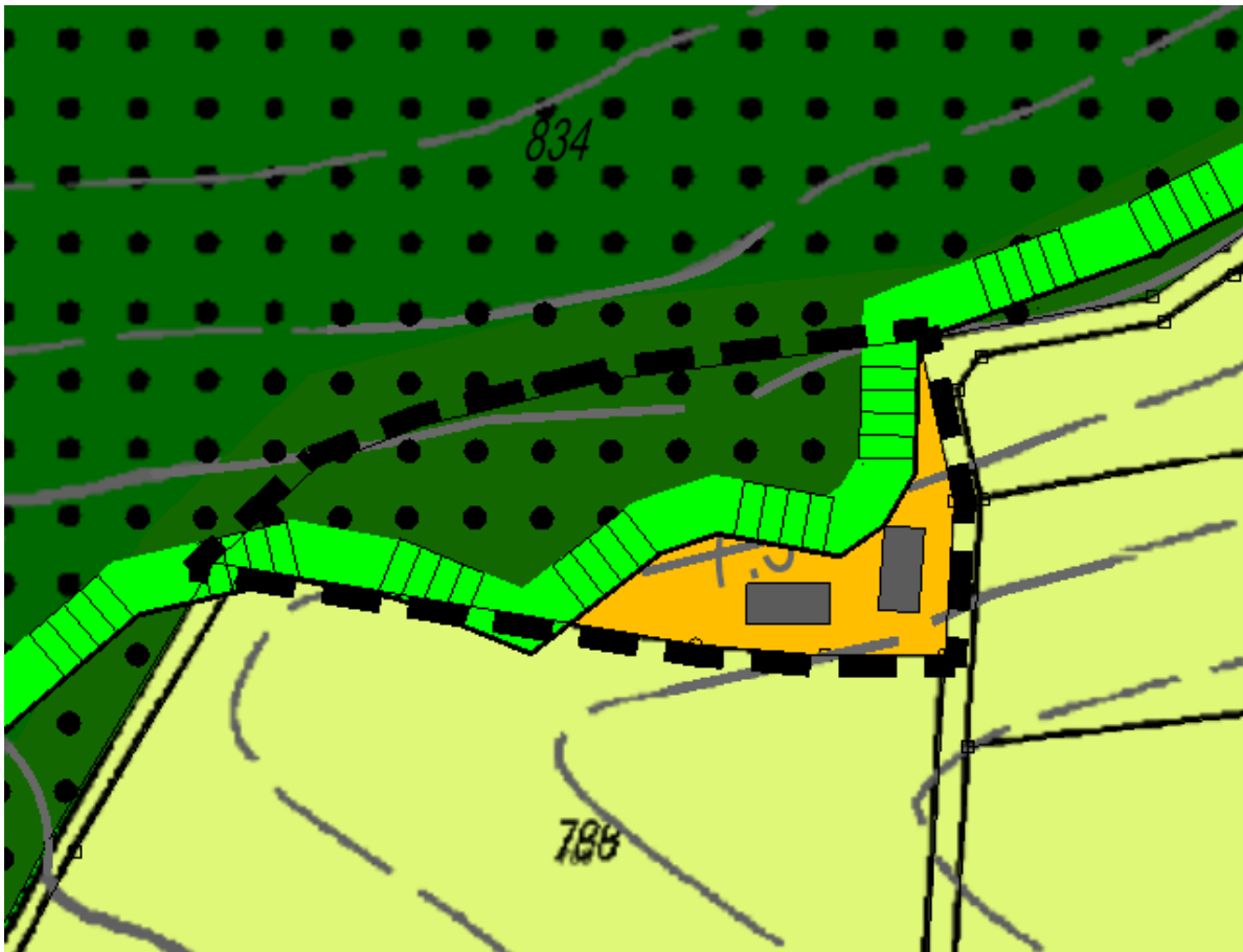
Abbildung 2: Auszug aus der 9. Änderung des Flächennutzungsplanes der Gemeinde Bergheim (i.d.F. von 18.06.2018) mit Kennzeichnung des Geltungsbereichs der 9. Änderung des Flächennutzungsplanes, ohne Maßstab

Da nunmehr die Fläche für Landwirtschaft entsprechend der tatsächlichen Nutzung zum Teil als Sondergebiet mit der Zweckbestimmung „Waldkindergarten“ und zum Teil als Fläche für Wald dargestellt werden soll, ist die vorliegende 9. Änderung des Flächennutzungsplanes erforderlich. Zudem wird die aktuelle Grenze des Landschaftsschutzgebietes, die nun nach aktuellen Kenntnissen weiter südlich verläuft, nachrichtlich aufgenommen. Der Gemeinderat der Gemeinde Bergheim hat daher in seiner Sitzung am 16.04.2018 beschlossen, den Flächennutzungsplan zum 9. mal zu ändern.