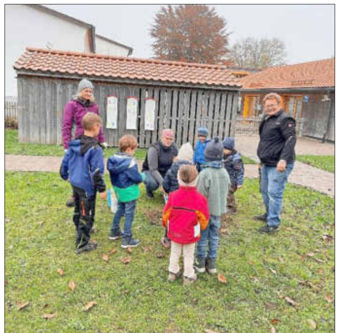
Diese gemeinsame Aktion hat den Kleinen viel Freude bereitet.