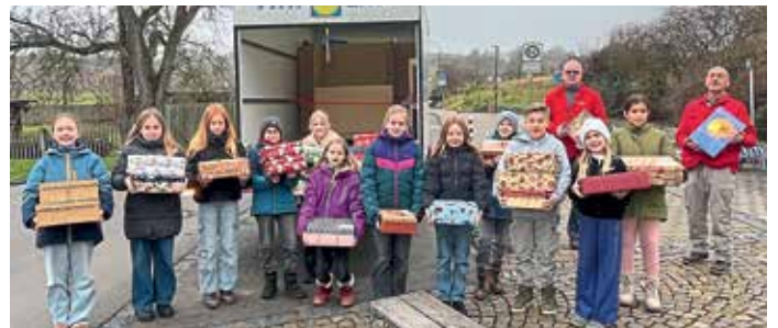
Text/Bild: Nicola Tank/ Veronika Burghardt

Ein herzlicher Dank gilt allen Familien, Schülerinnen und Schülern sowie Lehrkräften, die diese Aktion durch ihre Unterstützung möglich gemacht haben. Besonders danken wir dem Elternbeirat für die Organisation und Koordination der Teilnahme. Wir sind stolz auf dieses gemeinsame Zeichen der Mitmenschlichkeit und hoffen, dass die Geschenke den Kindern ein Lächeln ins Gesicht zaubern.