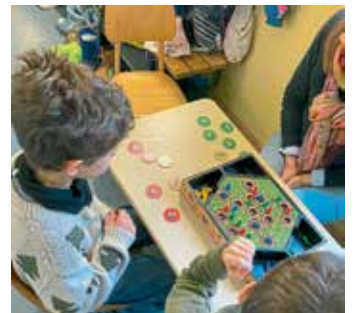
Text/Bild: Nicola Tank

Ein besonderer Schultag voller Spiel, Spaß und Gemeinschaft fand kurz vor Weihnachten, am 19.12.2025 an unserer Schule statt: Beim Spieletag hatten alle Klassen die Gelegenheit, in vier Unterrichtsstunden zahlreiche neue Spiele kennenzulernen und auszuprobieren. Gespielt wurden dabei Spiele, die unsere Schule zuvor bei dem Wettbewerb „Spielen macht Schule“ gewonnen hatte.