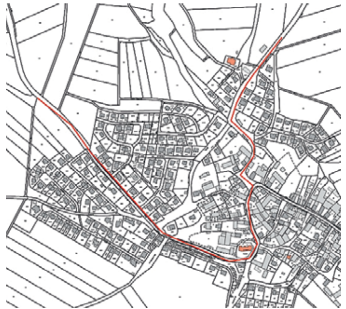
Rote Linie = gesperrte Straßen

Wir bedanken uns bereits jetzt für Ihr Verständnis.