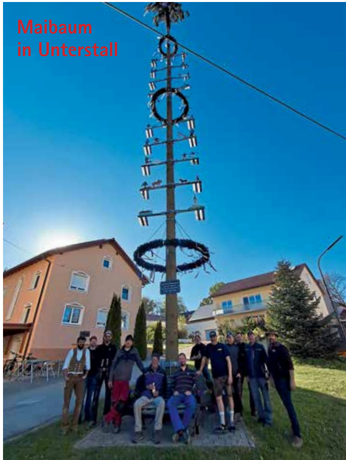
Maibaum in Unterstall