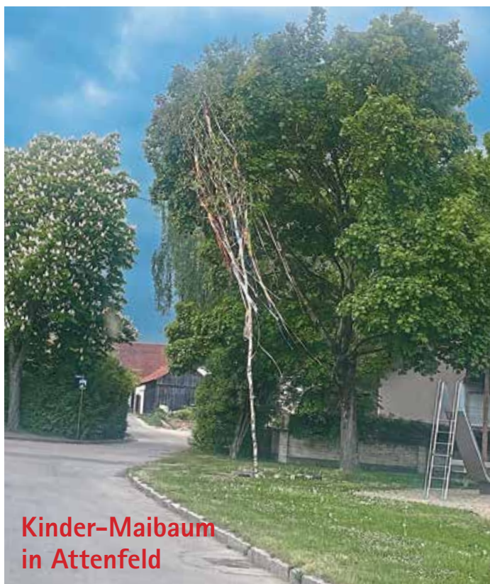
Kinder-Maibaum in Attenfeld