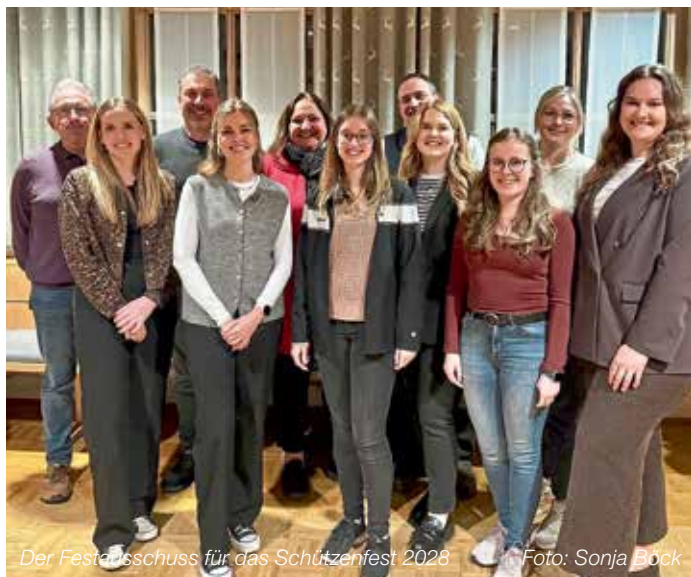
Der Festausschuss für das Schützenfest 2028