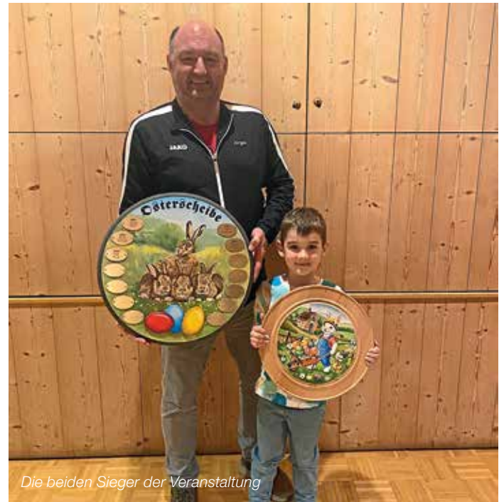
Die beiden Sieger der Veranstaltung