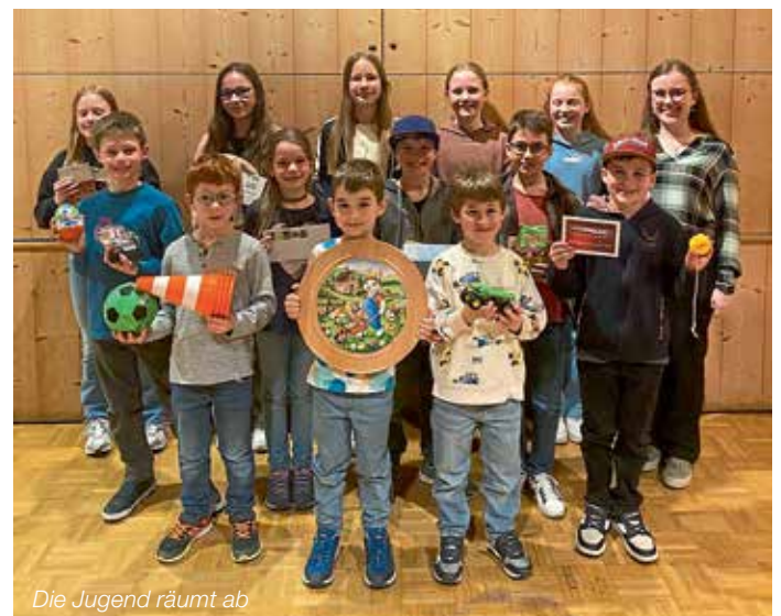
Die Jugend räumt ab