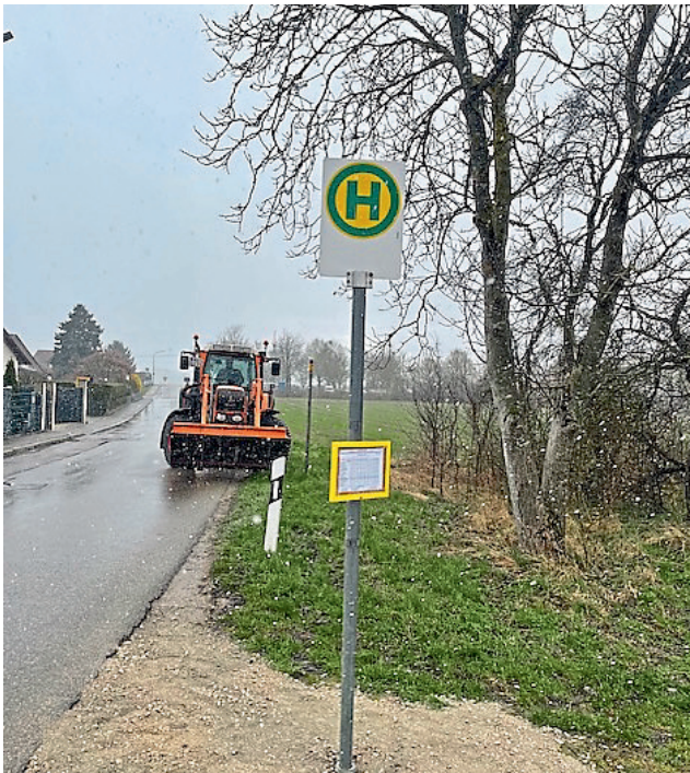
Die Kinder in der Joshofener Str. können jetzt an einem befestigten Feldweg einsteigen